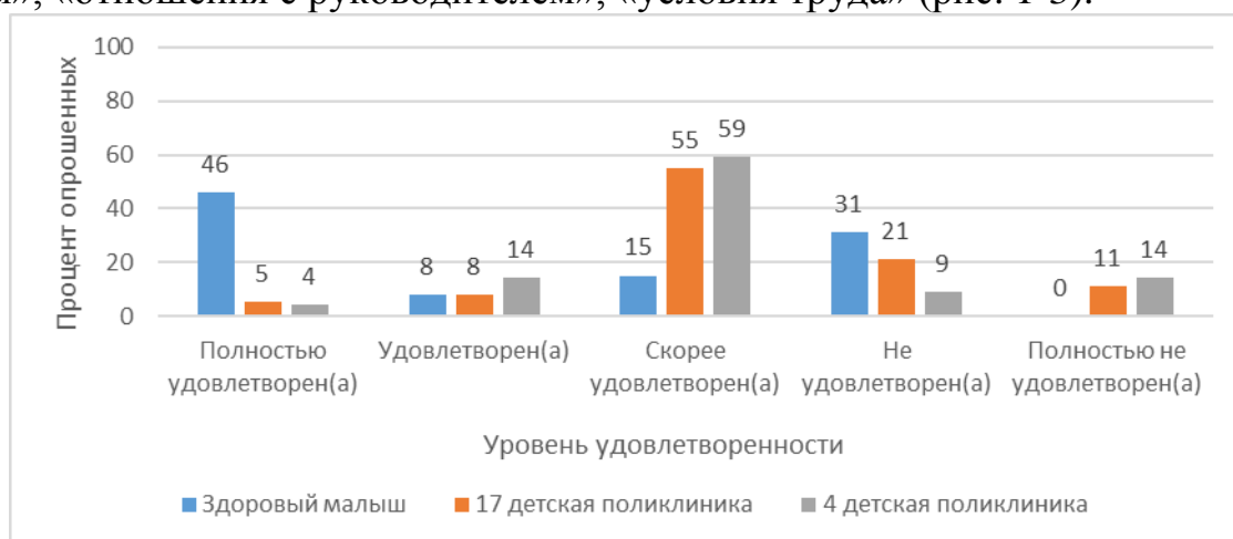
Рисунок 1. Степень удовлетворенности врачей своим трудом по показателю «размер заработной платы».

Ниже представлены графики распределения по степени удовлетворенности врачей своим трудом по показателям «размер заработной платы», «отношения с руководителем», «условия труда» (рис. 1-3).